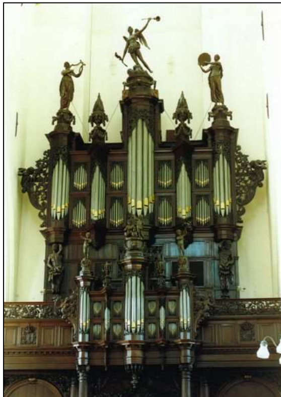
Het huidige Schnitger-orgel